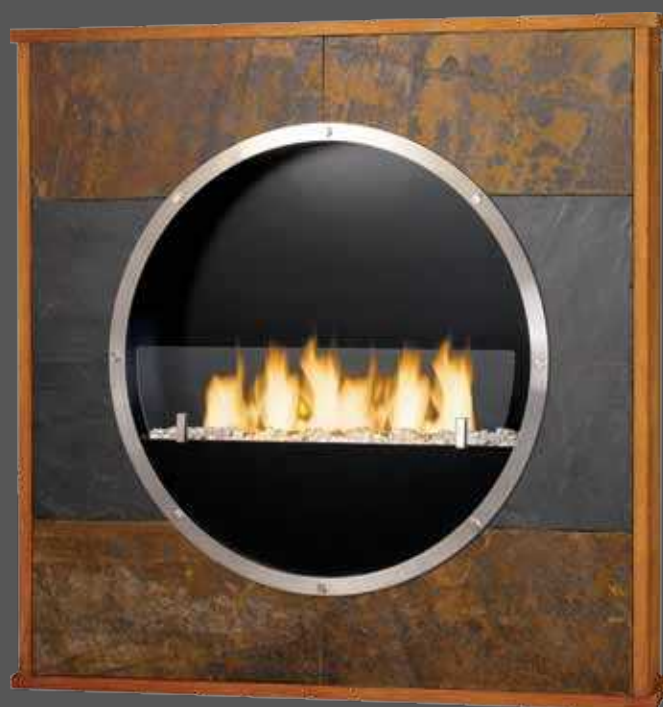
“CHACHA” 8650D 95 x 15 x h.95 cm (55 kg)