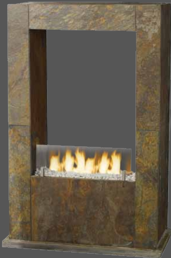
"RUMBA" 85000 65 x 35 x h.100 cm (85 kg) 6 mèches, réservoir 2,5 L