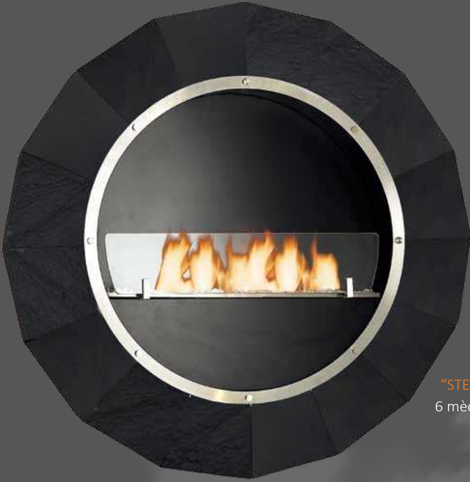
"STEP BLACK" 8655BL Ø95 x 15 cm (38 kg) 6 mèches, réservoir 2 L