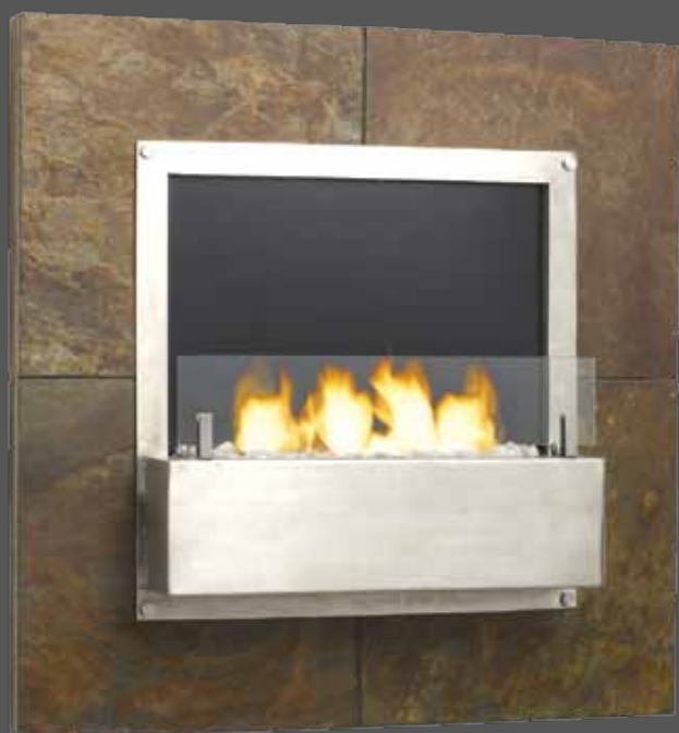
“MENUET” 8600ST 65 x 15 x h.65 cm (24 kg) 4 mèches, réservoir 1,5 L