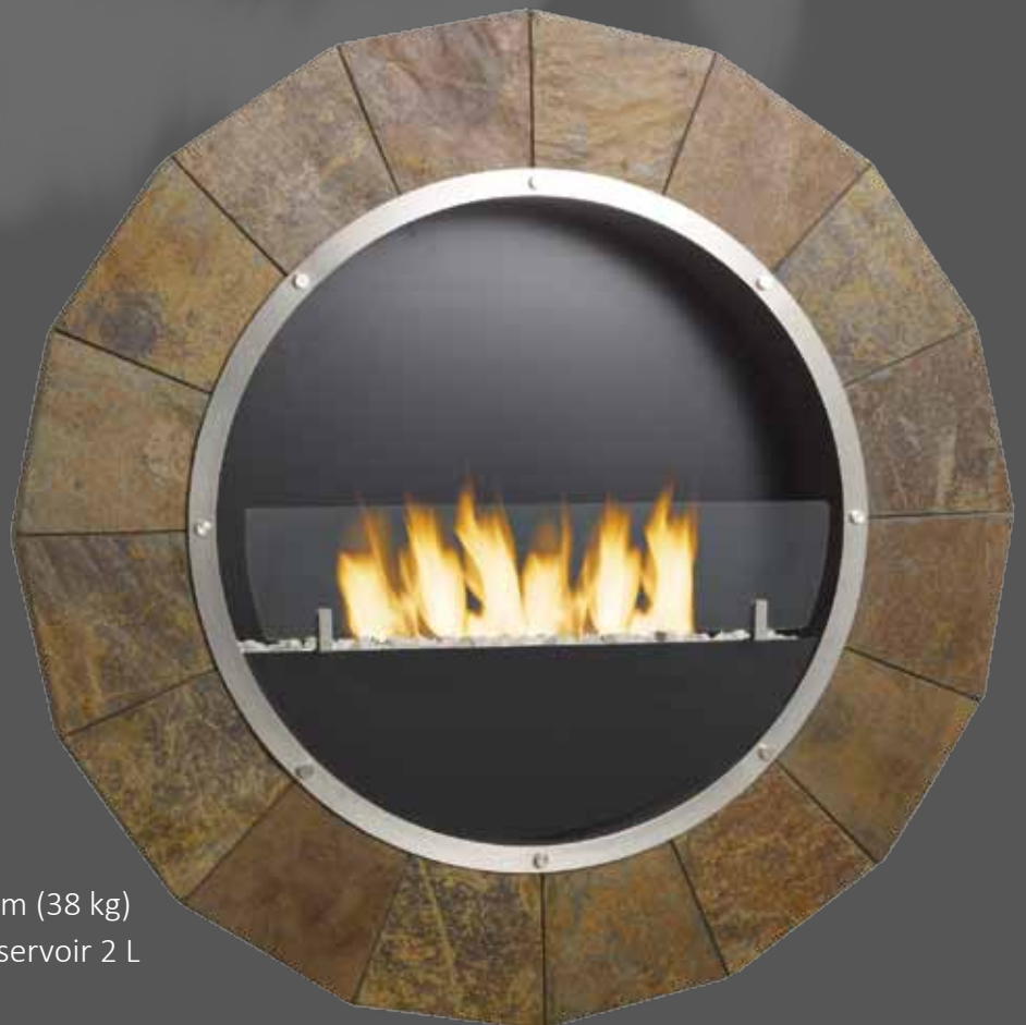
"STEP" 8655 Ø95 x 15 cm (38 kg) 6 mèches, réservoir 2 L