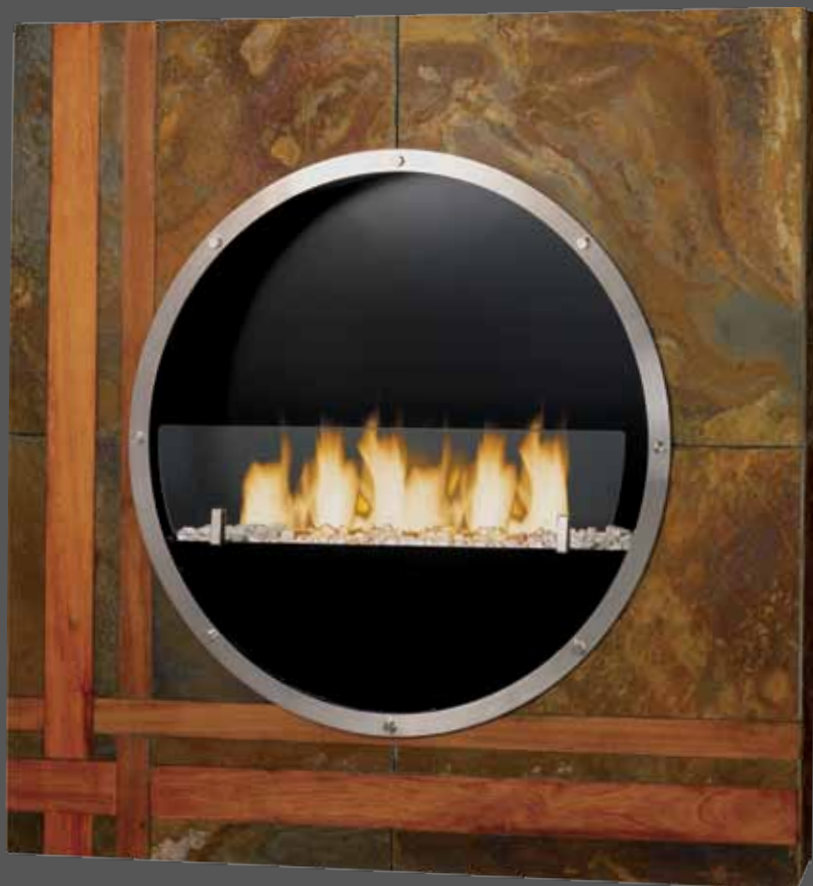
“FLAMENGO” 8651D 95 x 15 x h.95 cm (65 kg) 6 mèches, réservoir 2 L