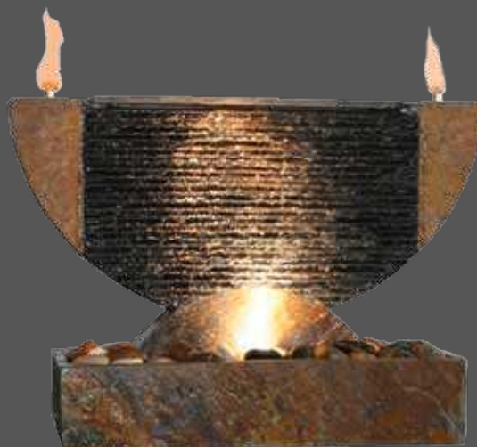
"OLYMPE" 39920 60 x 27 x h.74 cm (45 kg) 2 brûleurs, 2 mèches, pompe et galets. Eclairage par barette de LED blanches en option.