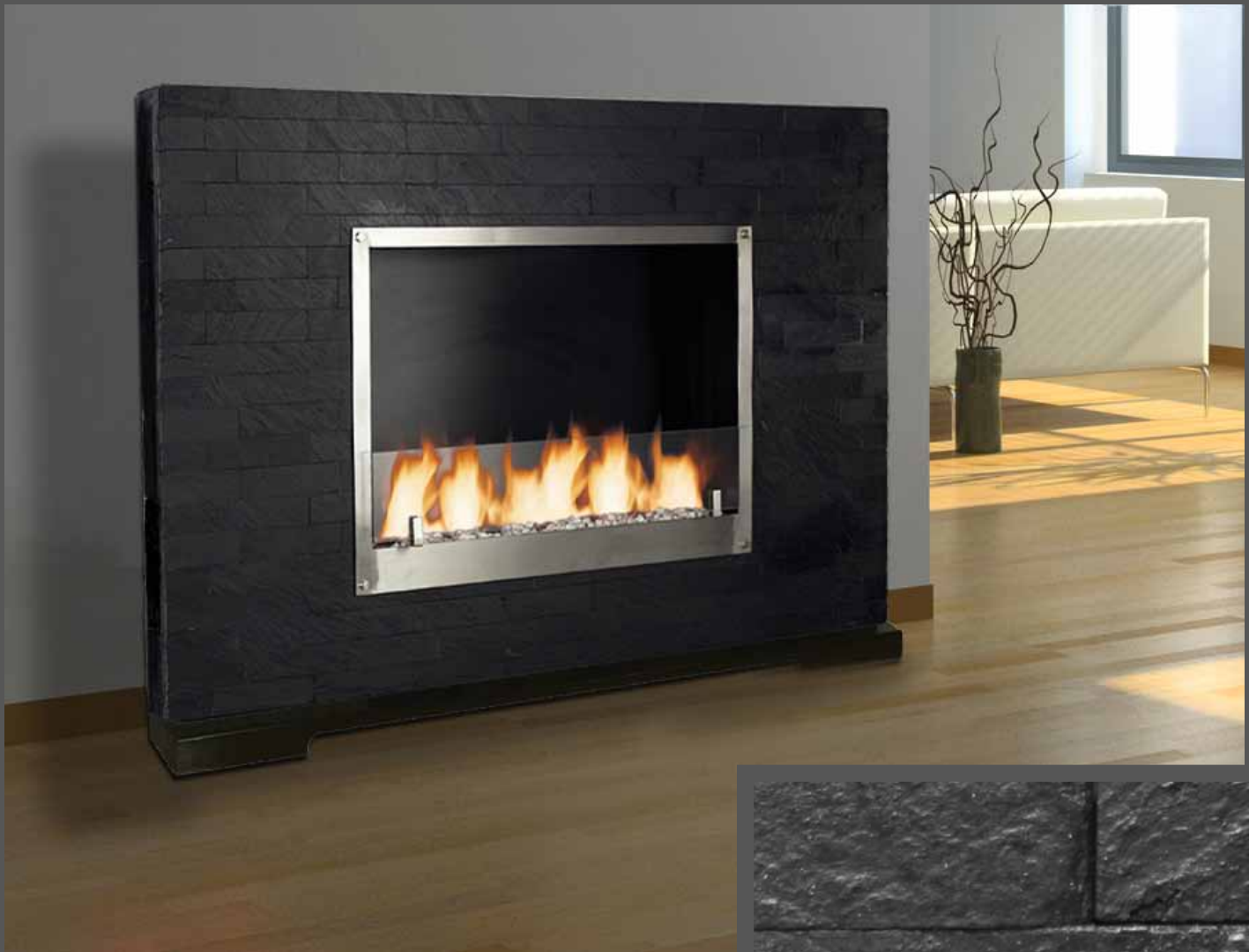
"MAMBO BLACK" 8700BBL 120 x 15 x h.80 cm (65 kg) 7 mèches, réservoir 2 L ; option piètement en métal réf. 8900