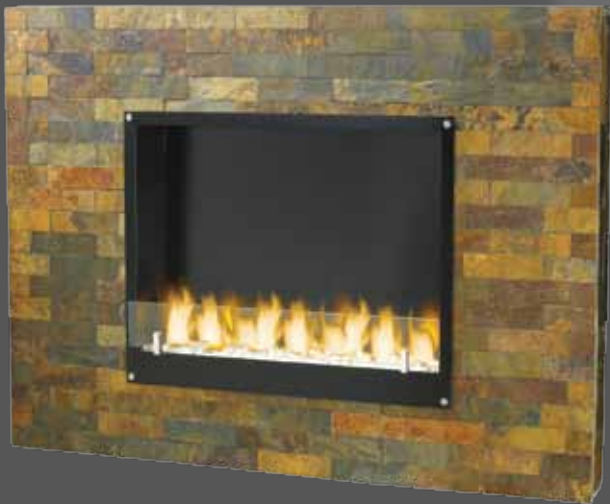
"MAMBO" 8700B 120 x 15 x h.80 cm (65 kg) 7 mèches, réservoir 2 L ; option piètement en métal réf. 8900